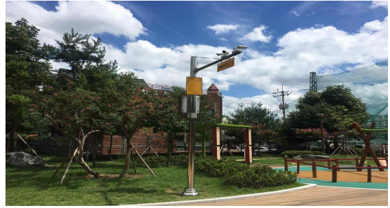
생활안전 CCTV 설치(삼익공원)