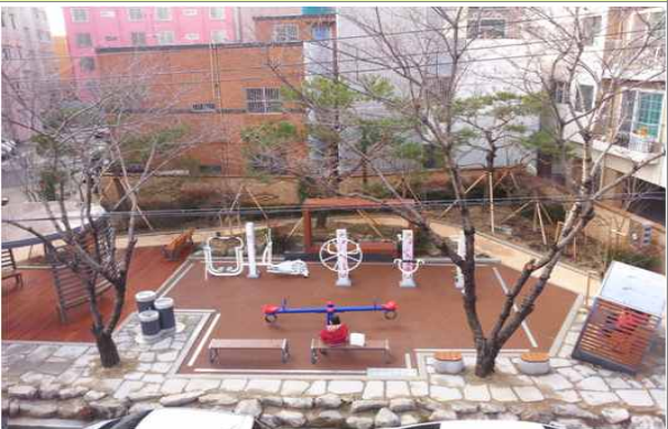
비산6동 소공원 조성