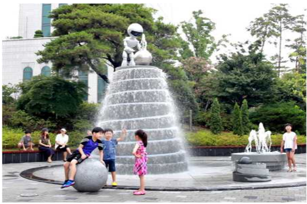
중리동 수경시설 조성