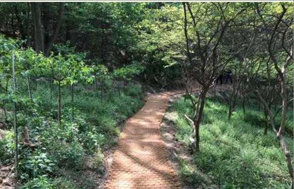
상리공원 등산로 정비사업