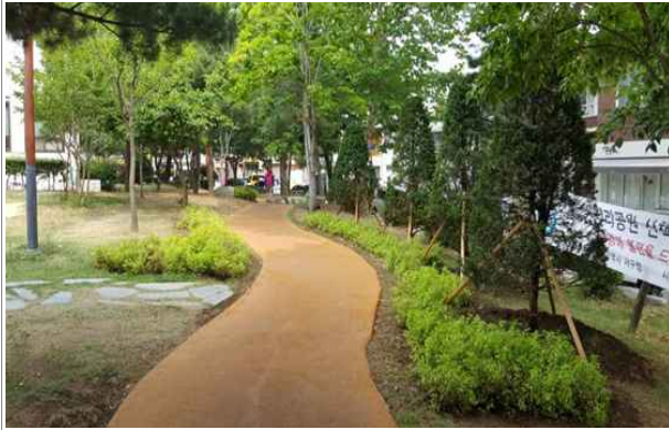
평리공원 산책로 정비공사