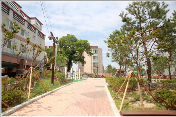
평리3동 당산목공원 조성