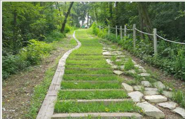
와룡산 등산로 정비사업