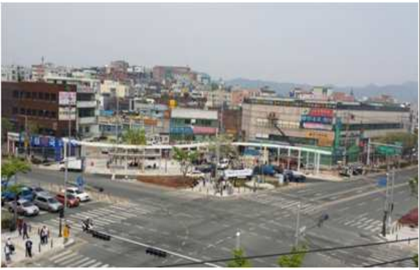
북비산네거리 명품가로공원 조성공사